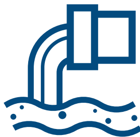
Águas Residuais e Saneamento