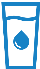
Água para consumo humano